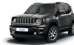
503 Sting Grey (pastelowy)