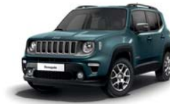
435 Niebieski Shade (metalizowany)