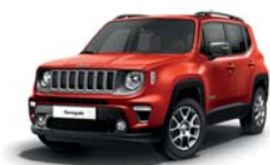
176 Czerwony Colorado (pastelowy)