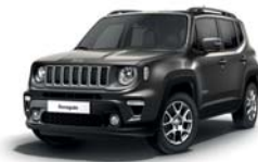
503 Sting Grey (pastelowy)