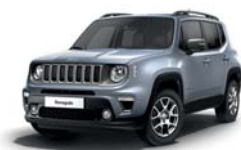
348 Srebrny Glacier (metalizowany)