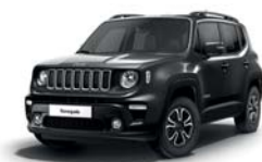
095 Grafitowy Granite Crystal (metalizowany)