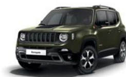
149 Zielony Matt Green (matowy) - tylko wersja Trailhawk