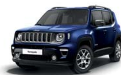
888 Niebieski Jetset (metalizowany)