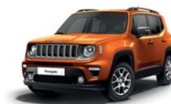
562 Pomarańczowy Omaha (pastelowy)