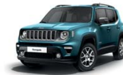
470 Bikini (metalizowany)