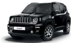
876 Czarny Carbon (metalizowany)