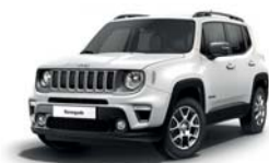
296 Biały Alpine (pastelowy)