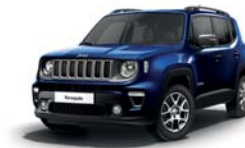
435 Blue Shade (pastelowy)