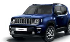
888 Niebieski Jetset (metalizowany)