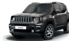
503 Sting Grey (pastelowy)