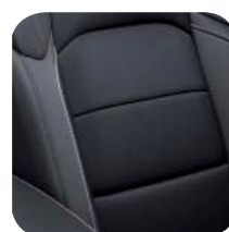
TAPICERKA SKÓRZANA BLACK