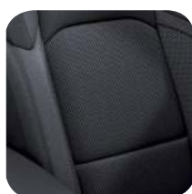
TAPICERKA MATERIAŁOWA BLACK