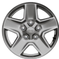
Aluminiowe obręcze kół 17" TECH SILVER