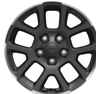
Aluminiowe obręcze kół 18" GRANITE CRYSTAL