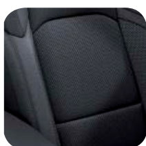
TAPICERKA MATERIAŁOWA BLACK SPORT