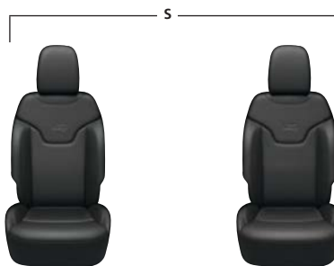
CZARNA SKÓRA ZE SZWAMI DIESEL GREY