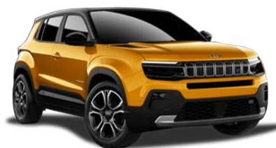
SUN ŻÓŁTY CZARNY DACH VOLCANO