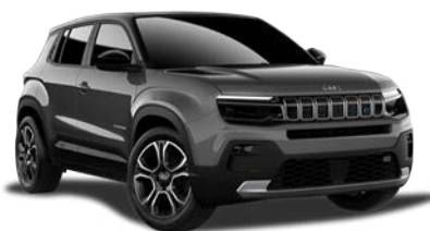
GRANITE SZARY CZARNY DACH VOLCANO