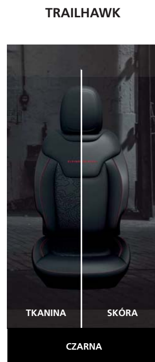
TKANINA | SKÓRA