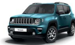
470 Bikini (metalizowany)