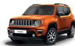
562 Pomarańczowy Omaha (pastelowy)