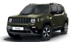
149 Zielony Matt Green (matowy) - tylko wersja Trailhawk