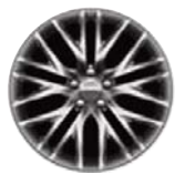
Aluminiowe obręcze kół Satin Carbon 20" x 8.0" opcja WSQ