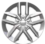
Aluminiowe obręcze kół 18" x 8.0" opcja WCT