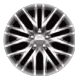
Aluminiowe obręcze kół 20" x 8.0" opcja WSR