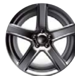
Aluminiowe obręcze kół 20" x 10" opcja WSH