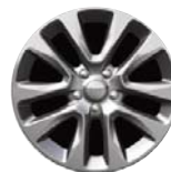
Aluminiowe obręcze kół 20" x 8.0" opcja WST