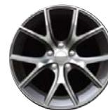
Kute lekkie aluminiowe obręcze kół 20" x 10" opcja WRM