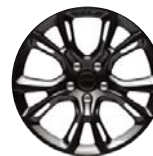
Kute aluminiowe obręcze kół w kolorze Carbon Black 20" x 10" opcja WPM