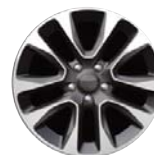
Aluminiowe obręcze kół 20" x 8.0" opcja WSP