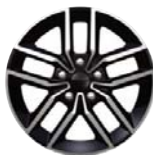
Aluminiowe obręcze kół 18" x 8.0" opcja WCV