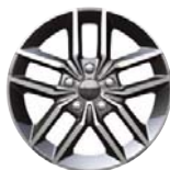
Aluminiowe lakierowane obręcze kół 18" x 8.0" opcja WBC